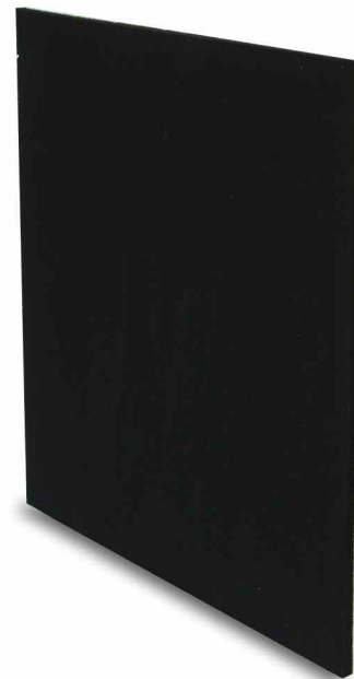
◀ Beispiel: Flachabsorber EPF 11 (50 x 50 x 1 cm)

Bitte senden Sie uns Ihre Anfrage mit Typenbezeichnung und Stückzahl. Sie erhalten ein unverbindliches Angebot.